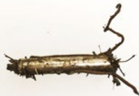
Ejemplo típico de un imán recuperado